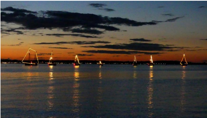
Der beeindruckende Lichterkorso vor Laboe

Am Sonntagabend finden die „HFTL“ mit dem Auftritt unseres Shanty-Chores ihren stimmungsvollen Ausklang.