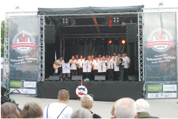
Der OSL-Shantychor auf der „HFTL“-Bühne

...gehören sie doch ans Ende eines jeden Laboer Hafenfestes wie die Feuerwehrkapelle in Wacken an den Anfang des dortigen Heavy-Metal-Events.