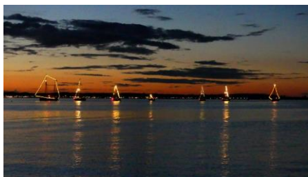
Der beeindruckende Lichterkorso vor Laboe

Am Sonntagabend finden die „HFTL“ mit dem Auftritt unseres Shanty-Chores ihren stimmungsvollen Ausklang.