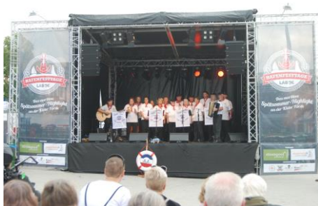
Der OSL-Shantychor auf der „HFTL“-Bühne

Am Sonntagabend finden die „HFTL“ mit dem Auftritt unseres Shanty-Chores ihren stimmungsvollen Ausklang.