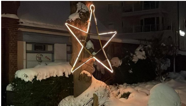
Mit Weihnachtsstern, Schnee und ...

Schon seit Tagen erleuchtete der OSL-Weihnachtsstern den Hafenvorplatz und ließ die Vorfreude auf das bevorstehende Weihnachtsfest ansteigen. Der schönen Tradition des Lebendigen Adventskalender kommt auch Ole Schippn Laboe in diesem Jahr genau am Nikolaustag wieder nach. Nicht weniger als zwölf Vereinsmitglieder waren mit den Vorbereitungen betraut und verzauberten das Vereinsheim und den Platz davor in ein regelrechtes Wintermärchen. Zugegeben - Frau Holle hatte dieses Mal ein geschüttelt Maß Anteil an den Vorbereitungen. Damit der Nikolaus das Vereinsheim auch ja nicht verfehlt, haben wir die Einflugschneise mit Feuerkörben und Scheinwerfern stimmungsvoll erleuchtet.