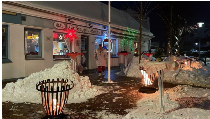
...Feuerkörben gleicht es einem Wintermärchen